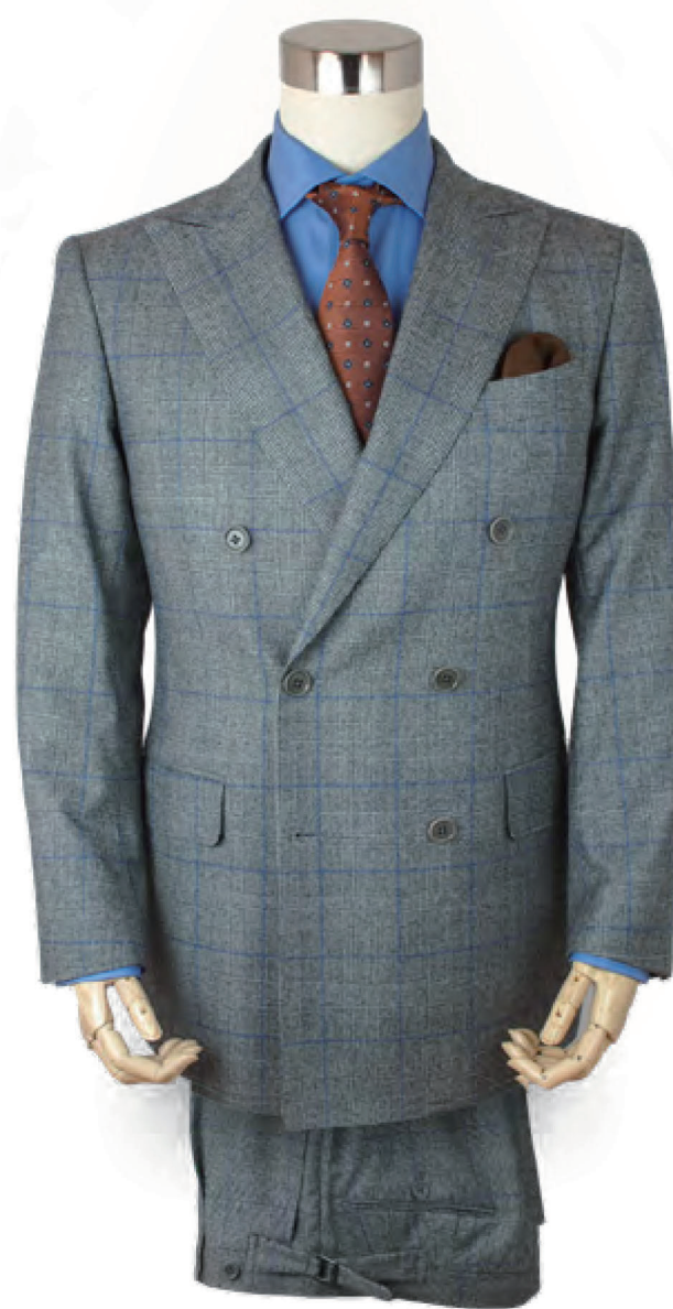
スーツ CACCIOPPOLI(カチヨッポリ) お仕立て上がり 価格: 110,000円

オーダーパンツ ウール 100% 16,000円～ コットン 100% 16,000円～ 輸入生地 23,000円～