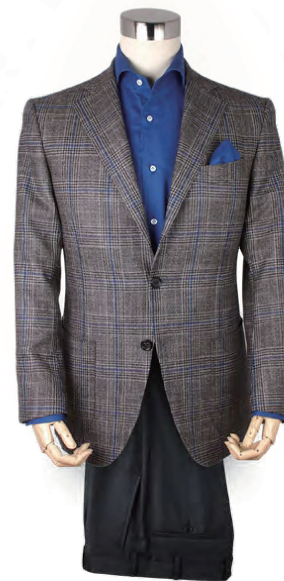
ジャケット CACCIOPPOLI(カチヨッポリ) お仕立て上がり 価格: 88,000円