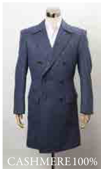
CASHMERE 100% カシミア 100% オーダーコート 150,000円