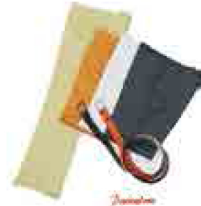
オーダーパンツ ウール 100% 17,150円～ コットン 100% 24,150円～ 輸入生地 24,150円～