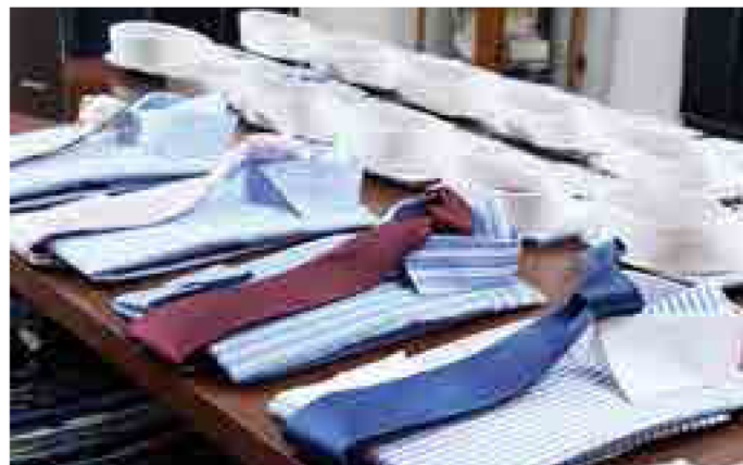
様々なスーツのデザインにマッチできるよう、クラシコイタリー・ブリティッシュ・アメリカン・ラディショナルスタイルのパターンを用意。25種類の襟型から、既製品に無いオンリーワンのデザインを