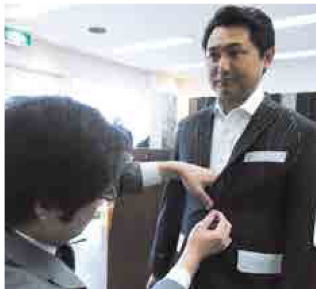
初めての人に推奨している、完璧なスーツを仕上げるための仮縫いは、オプションで付加でき、データは10年間保存される

オーダージャケット Ermenegildo Zegna 69,800円 オーダーシャツ Getzner 21,000円