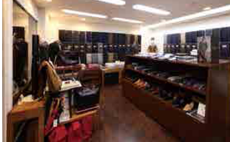
国内外の目利きのファブリックが多彩に揃っている