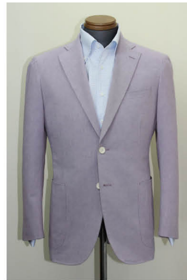
オーダージャケット ロロ・ピアーナ生地使用 ¥69,800 オーダーシャツ トーマスメイソン生地使用 ¥19,000