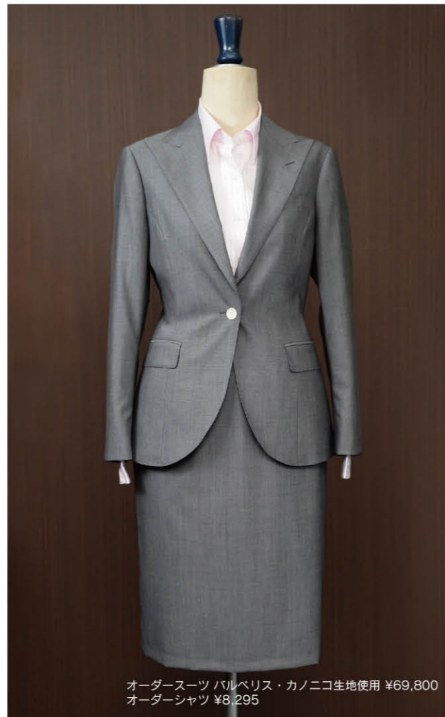
オーダースーツ バルベリス・カノニコ生地使用 ¥69,800 オーダーシャツ ¥8,295