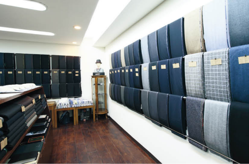
国内外の目利きのファブリックが多彩に揃っている