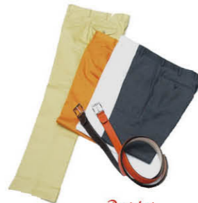
Pantaloni オーダーパンツ ウール100% ¥17,150~ コットン100% ¥24,150~ 輸入生地 ¥24,150~