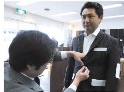
完璧なスーツを仕上げるための仮縫いもオプションで付加できる。テーラーは10年間保存される

様々なスーツのデザインにマッチできるように、クラシコイタリー・ブリティッシュ・アメリカン・カンタリディショナルスタイルのボタンを用意。25種類の襟型から、既製品に無いオリジナルなデザインを