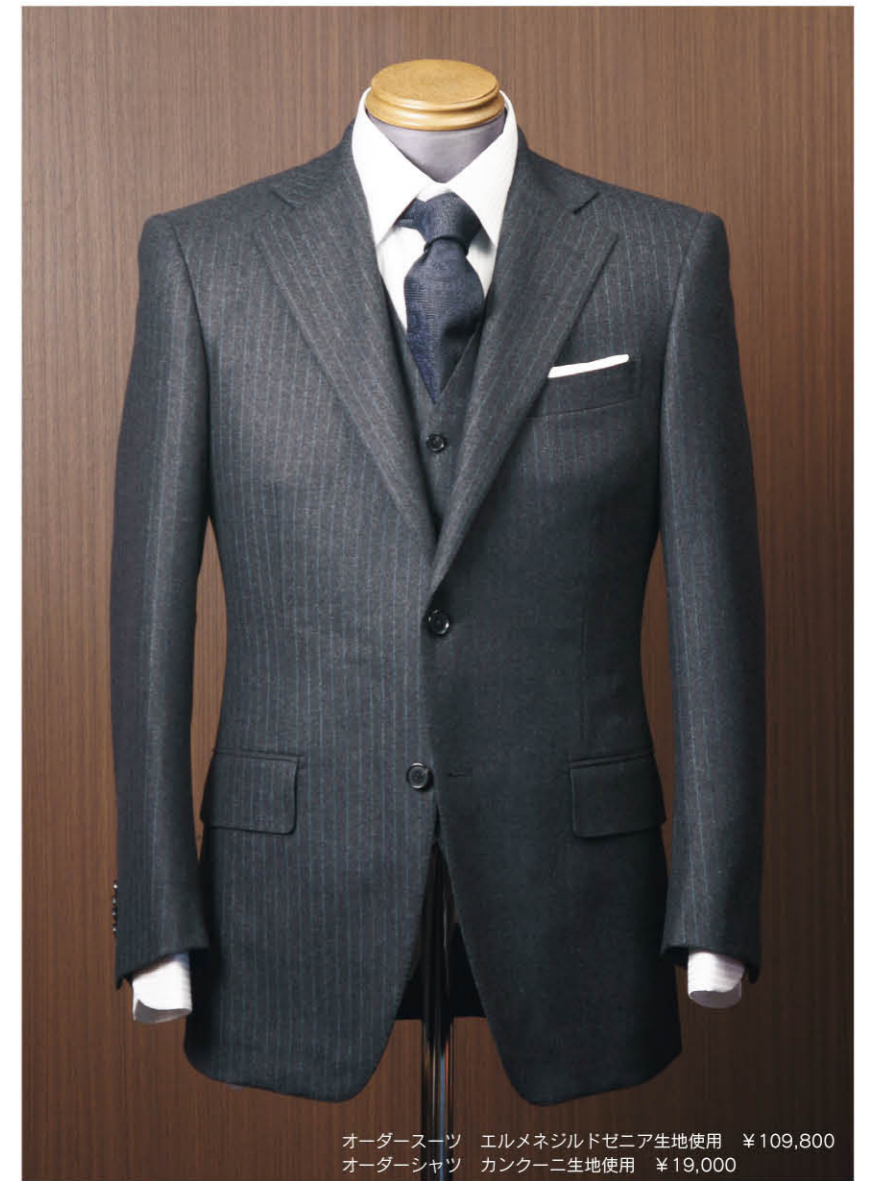
オーダースーツ エルメネジルドゼニア生地使用 ¥109,800 オーダーシャツ カンクーニ生地使用 ¥19,000

使い込むほどにツヤと味がでる高価な水牛のホーンボタン(オプション)を使用し、袖が実際に開閉できる本切羽を採用。既製品では味わえない高級感が漂う