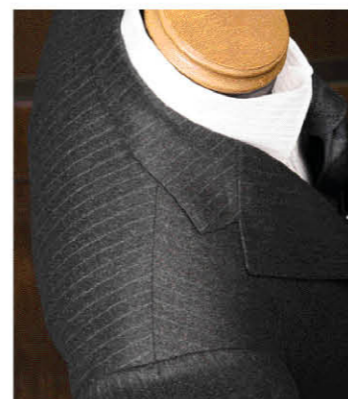
日本人の肩の特徴に合わせて、肩線がゆるやかなカーブを描きながら前方へ張り出している(前肩補正)。この絶妙な曲線を出すためには、高いレベルの裁断技術が必要とするが、同時に抜群の着心地をもたらす