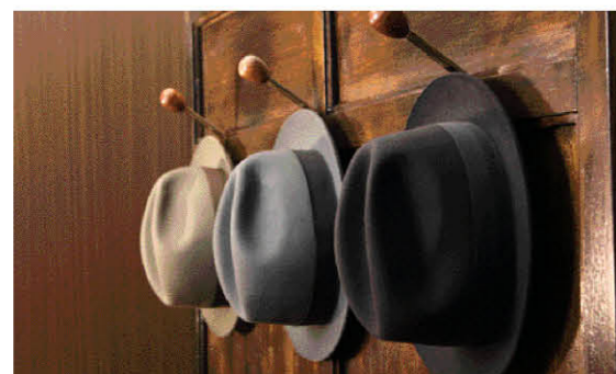
イーストでは、スーツのほかに、シャツや靴のオーダーも扱っている。ハットはイタリアのテシ社のもの