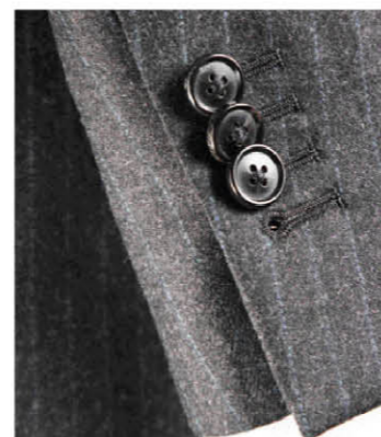
使い込むほどにツヤと味がでる高価な水牛のホーンボタン(オプション)を使用し、袖が実際に開閉できる本切羽を採用。既製品では味わえない高級感が漂う