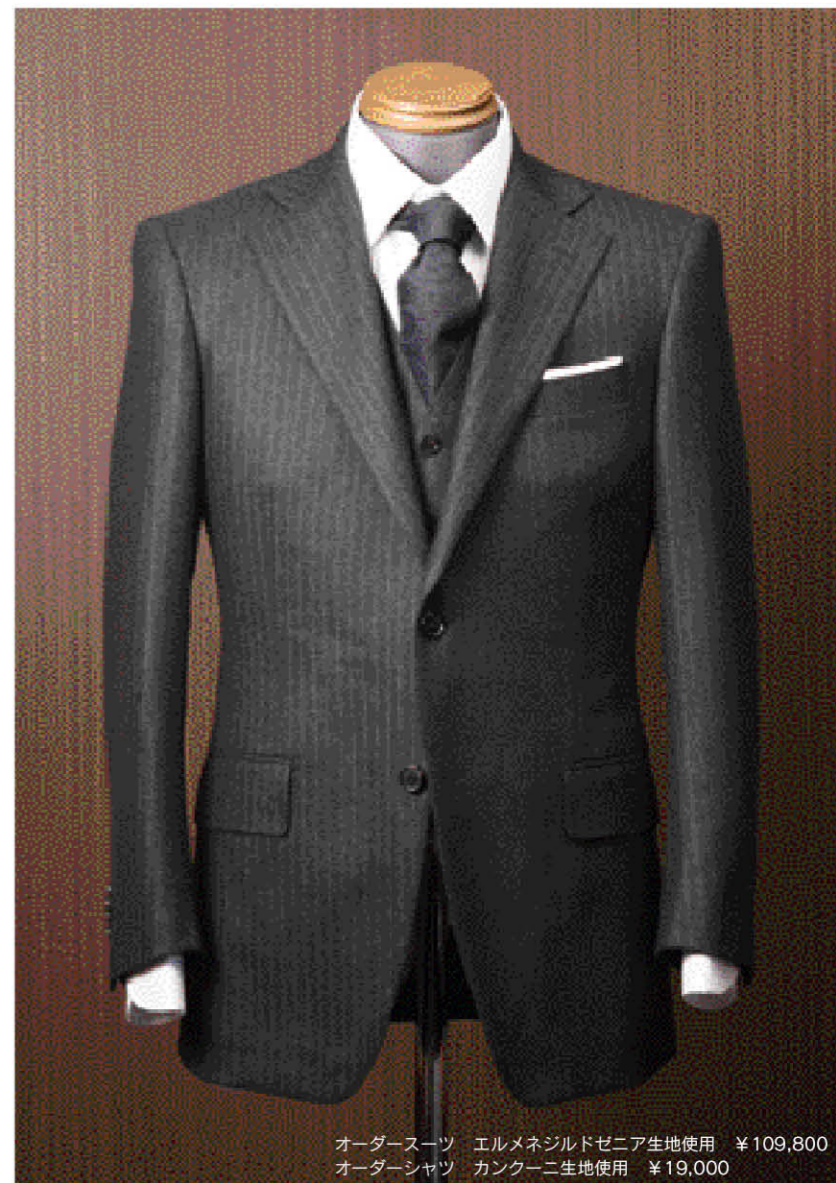
オーダースーツ エルメネジルドゼニア生地使用 ¥109,800 オーダーシャツ カンクローニ生地使用 ¥19,000