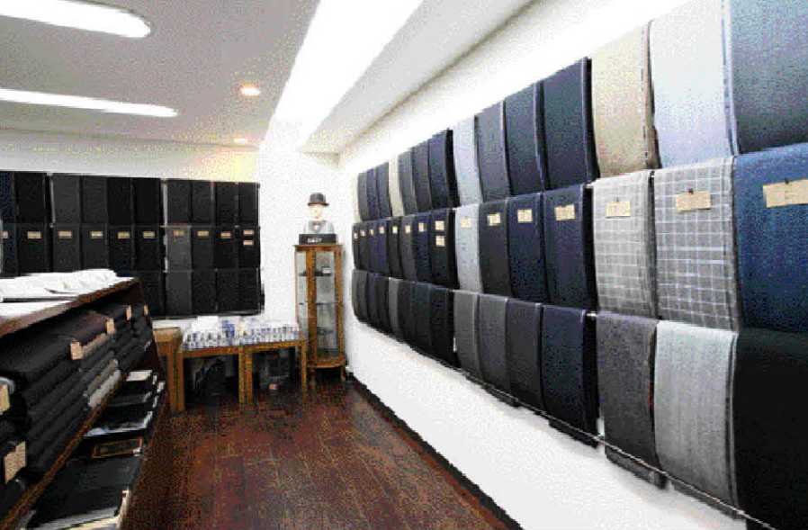
国内外の目利きのファブリックが多彩に揃っている