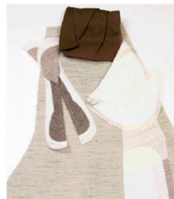
芯地には高級スーツの代名詞とも言える本バスを使用。立体感のあるシルエットをつくり出し、耐久性にも優れていてフィット感のある着心地が長続きする